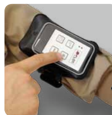
Sport-Etui für Handsender (Art. 5016)