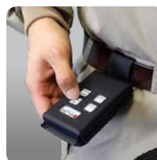
Etui mit Gürtelschleufe für Handsender (Art. 4716)