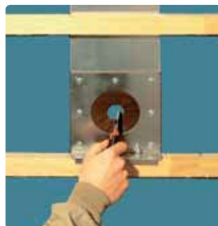
Выполните задувное отверстие