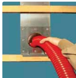
Вставьте выдувной шланг