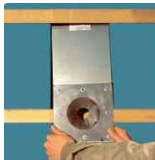
Монтаж на опорных балках